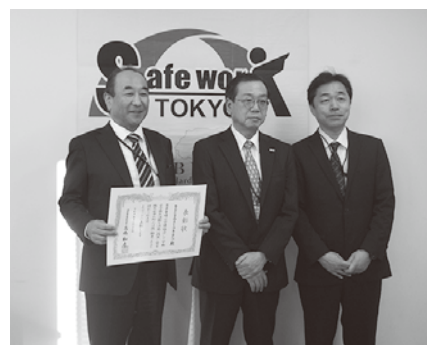
(株) 日立プラントコンストラクション