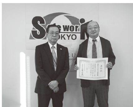
東京都チャレンジプラストツパン(株)