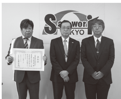
有機合成薬品工業 (株) 東京研究所