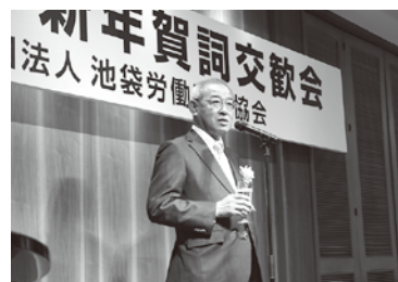
豊島産業協会白井会長